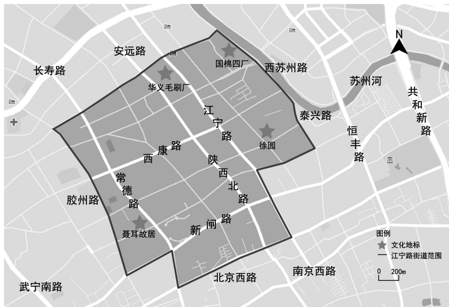
图1 江宁路街道地理范围示意图

江宁路街道位于上海市静安区中南部,其四至范围北为安远路、南为北京西路、东为胶州路、西为西苏州路和泰兴路,属于上海市中心闹中取静的地块(图1)。历史上的江宁路街区,原本是上海西郊的一片农田,1899年被划入上海公共租界的范围。1900年,公共租界工部局修筑了一条南北走向的马路,时称“戈登路”(戈登是当时英国洋枪队首领的名字)经过此地。道路通车后,沿路形成了住宅和工厂的混合分布区,这就是江宁路街道作为工业与居住混合区域的最初形态。1943年,汪伪政权接管租界后,将戈登路改名为江宁路。抗日战争后期,江宁路地块成为国民政府在上海的32个行政区之一。新中国成立之后,江宁区建制被撤销,经过数次的行政区划调整,目前是静安区下属的一个街道办事处。在近百年的发展变迁中,江宁路街道辖区逐步由城市郊区变身为繁华的闹市,曾存在不少的老民居、老弄堂,也曾建有20世纪工业化初期的许多老厂房、老宿舍,还有租界时期遗留的具有中西文化交汇特色的公馆和教堂;而在20世纪末以来的城市更新中,这一地块也依托优越的区位条件和良好的社会经济基础,较早经历了城市更新和旧城改造,并逐步成为商务楼宇和城市精英阶层的集聚之地。不同国籍、不同民族、不同信仰的“新上海人”在此工作、生活,使其逐步成为兼具全球化和上海地方特色的时尚文化街区。值得指出的是,在快速的城市更新中,江宁路街道大多数遗存的物质文化景观或者消失,或者淹没在大片的新景观之中,难寻足迹,而旧城改造还促成了大量老居民的异地搬迁,新楼盘的开发则引进了不少的新住户。由此,这一街区无论在景观形态或居民结构上都发生了显著的变化,无论新老居民,都面临社区感、地方感重构的压力。增进居民和社会各界对江宁路街道的记忆,不仅有助于社区凝聚力的提升,也有助于地方品牌和社区旅游的发展。江宁路街道办牵头举办的“记忆江宁”系列文化活动,通过全部18个居民委员会,向当前工作、生活在江宁的所有市民征集他们认为最有文化内涵的街区历史景观,同时,也欢迎曾经的老居民参与;在此基础上,基于入选的历史景观面向社会公开征集绘画作品,以完成“记忆江宁”文化地图的编制,并印制了3000份“记忆江宁”文化地图,免费向社区居民和单位发